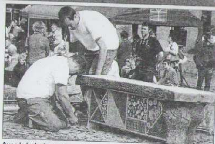
Avec le bois de quatre cerisiers qui ont dû être abattus, les services municipaux ont réalisé ce banc qui n'a rien d'un quelconque siège mais qui a été conçu comme un refuge à insectes.