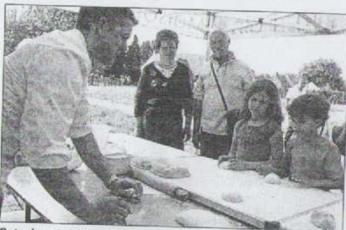
Outre le marché aux fleurs et des expositions d'artistes, des animations étaient proposées aux plus jeunes : la Maison du pain invitait à créer un petit pain en forme de hérisson.